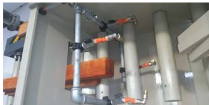
FASE DI PULIZIA